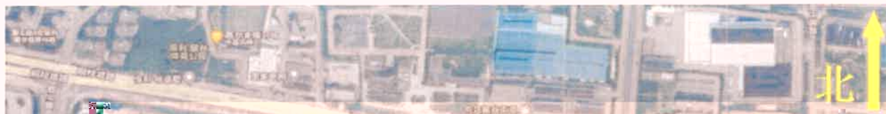
附图2：采样点位示意图